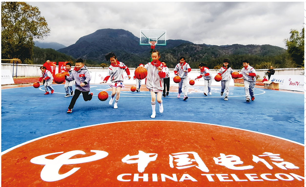
關愛農村地區兒童

興有效銜接取得顯著成效。充分發揮企業優勢，將數字鄉村建設作為深化行業幫扶、定點幫扶的重要舉措強力推進，實現數字鄉村產品與服務覆蓋全國1,600個區縣，累計建成數字鄉村示範鄉鎮1萬個，示範村10萬個，並在「4+2」幫扶縣建設10個集團級數字鄉村示範點，打造了數字賦能助力鄉村「五大振興」的電信樣板。中國電信在2020年有關定點扶貧成效考核中連續3年獲評最高等次評價，榮獲全國脫貧攻堅總結表彰先進集體等國家級榮譽。