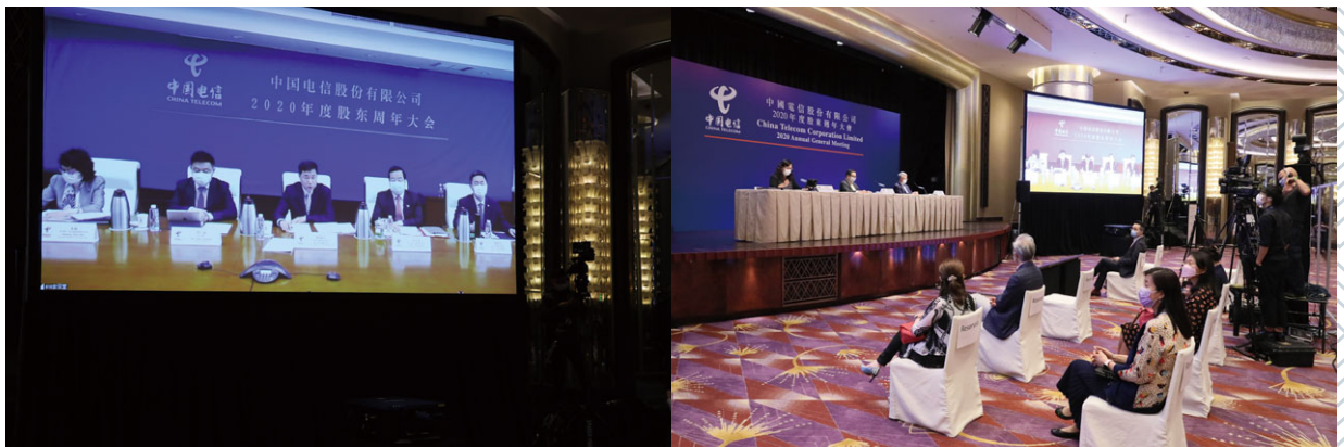
疫情影響下管理層通過視頻會議的方式出席在香港舉行的年度股東大會並與股東交流。