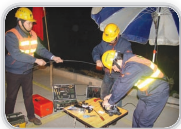
線路搶險人員在緊急接續光纖

中國電信擔負著保障通信安全暢通的重要任務。在冰雪、地震、洪澇、泥石流等各種自然災害面前，中國電信充分發揮應急通信指揮和保障體系的實力，全力開展搶修、搶險、通信保障等各項應對工作，為國家、公眾第一時間提供各類通信保障和支撐，努力把災害損失降低到最小。2011年防汛抗旱任務艱巨，中國電信堅持預防與保障並重的原則，從思想認識、組織體系、預案措施、安全檢查、隊伍物資、災情報告等方面認真開展工作，確保了通信暢通和生命財產安全。