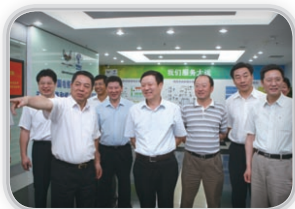
公司管理層親臨「大運會」指導工作

中國電信一直倡導綠色健康的網絡和手機文化，積極防範利用網絡傳播不健康內容，大力傳播適合社會健康有序發展的內容。2011年中國電信積極參與開展以「修身律己、做文明人」為主題的文明短信傳遞活動，引導公眾創作或轉發文明短信，傳播優秀文化。還通過「天翼閱讀」開展「全民閱讀」系列活動，包括「全民數字閱讀大講堂」、「師生同讀一本好書」等，倡導人人愛閱讀的社會風氣。