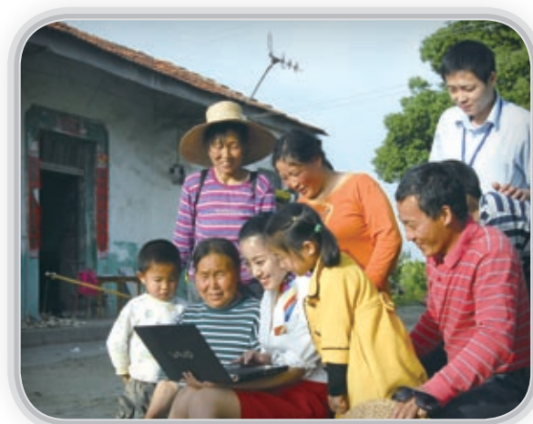
農村居民使用中國電信寬帶服務，享受信息化生活

縮小城鄉「數字鴻溝」，保證公民的基本通信權利是通信企業的共有責任。中國電信持續實施「村通工程」，加快農村服務網點建設，努力提升鄉鎮政府、農業企業、農民個人的信息化水平，2011年完成1.05萬個行政村通寬帶的任務。