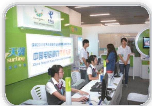
中國電信全心服務「大運會」

作為深圳2011年世界大學生運動會唯一通信全業務全球合作夥伴，中國電信組織千名技術人員，建設和開通賽事成績系統、賽事管理系統、賽事指揮系統「三大系統」和競賽網、賽事管理網、安保傳輸網、廣播電視信號傳送網「四張專網」，以及56個場館的信息技術設施，確保通信服務保障，得到組委會、運動員、媒體等各方的高度評價，榮獲大運會通信保障與服務工作「先進單位」稱號和「創新業務獎」。