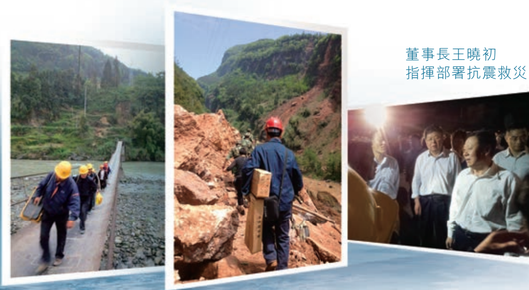
中國電信搶險隊員攜帶設備和工具徒步搶險

中國電信忠實履行保障通信安全暢通的任務。2013年積極抗擊雅安地震、颱風、洪澇等重大自然災害，以最快時間恢復災區通信，全年出動搶險人員11.86萬人次、救災車輛2.75萬台次、應急通信設備1,300台次，發送公益短信42億條。圓滿完成全運會、亞青會、中國—亞歐博覽會、南極科考等重大活動的通信保障任務。